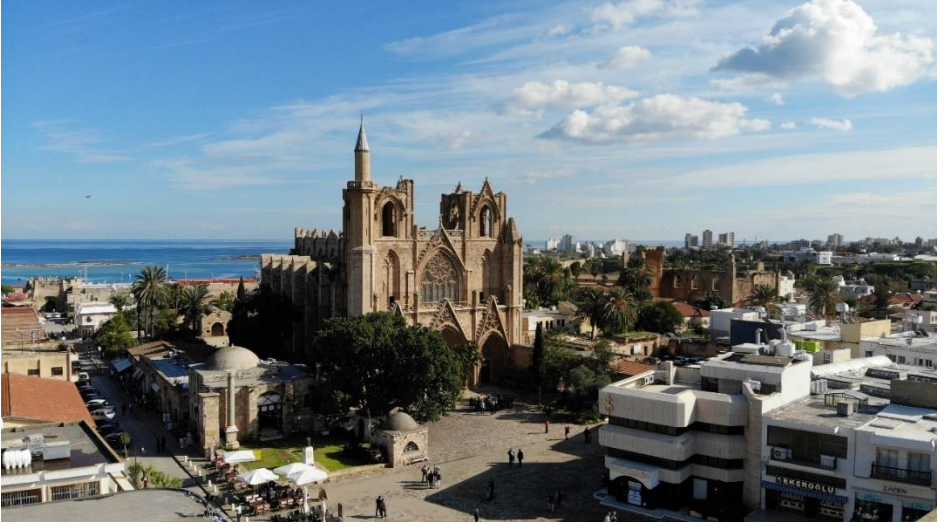
Solda Mağusa Sıbyan Mektebi ve Sağda Lala Mustafa Paşa Camii