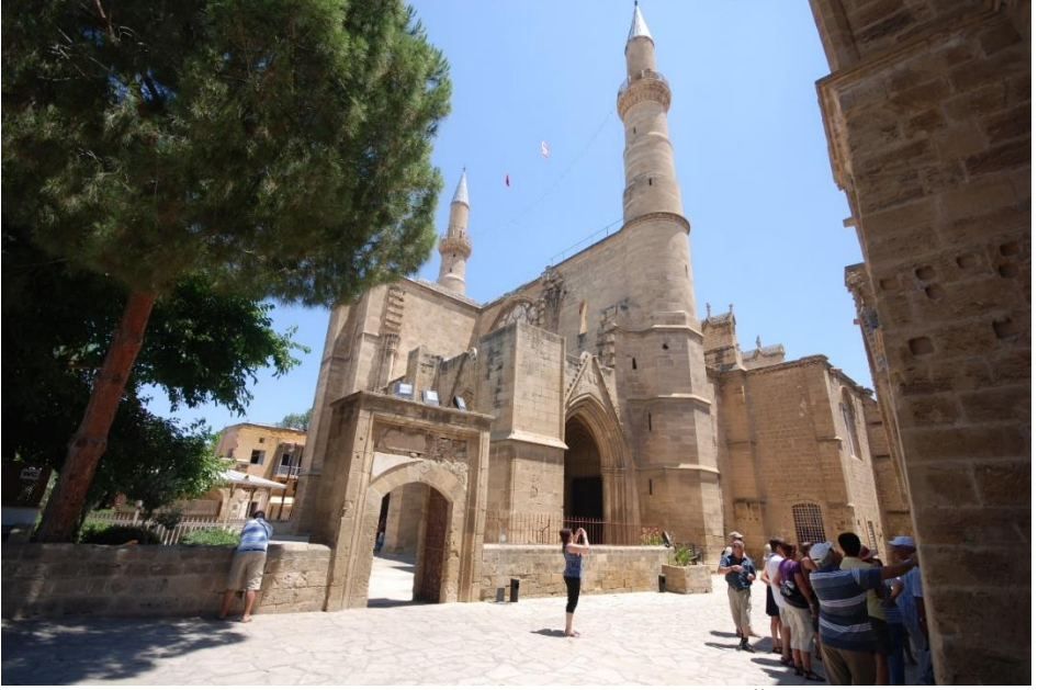
Sağda Bedesten Solda Selimiye Camii