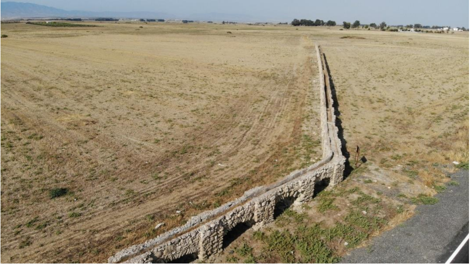
Arif Paşa Su Kemeru