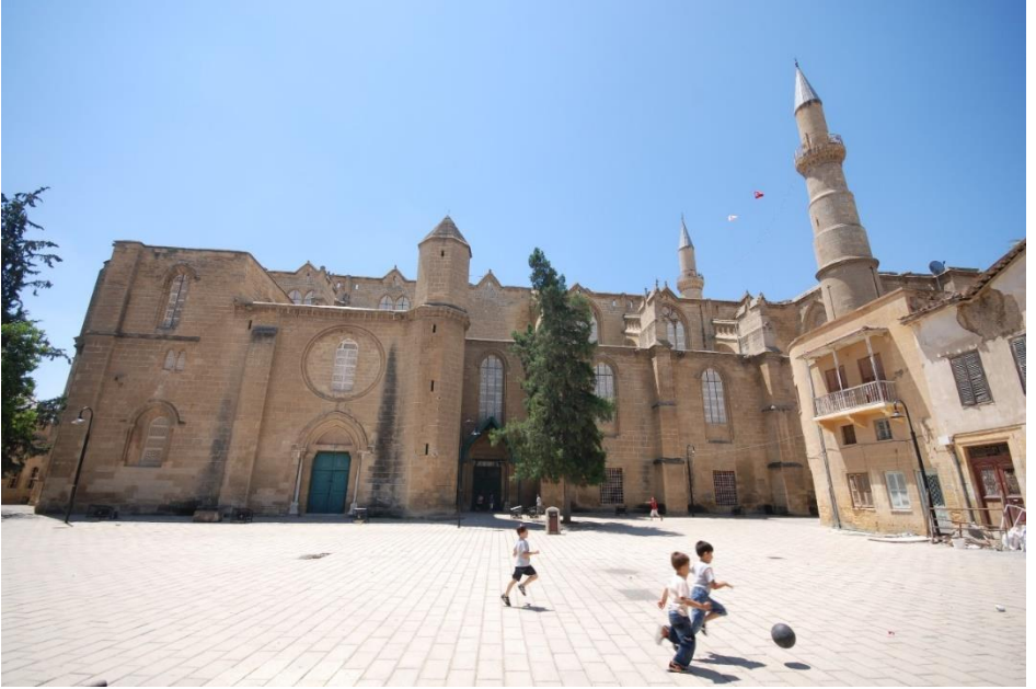
Selimiye Camii ve Eski Selimiye Medresesi'nin Olduğu Alan