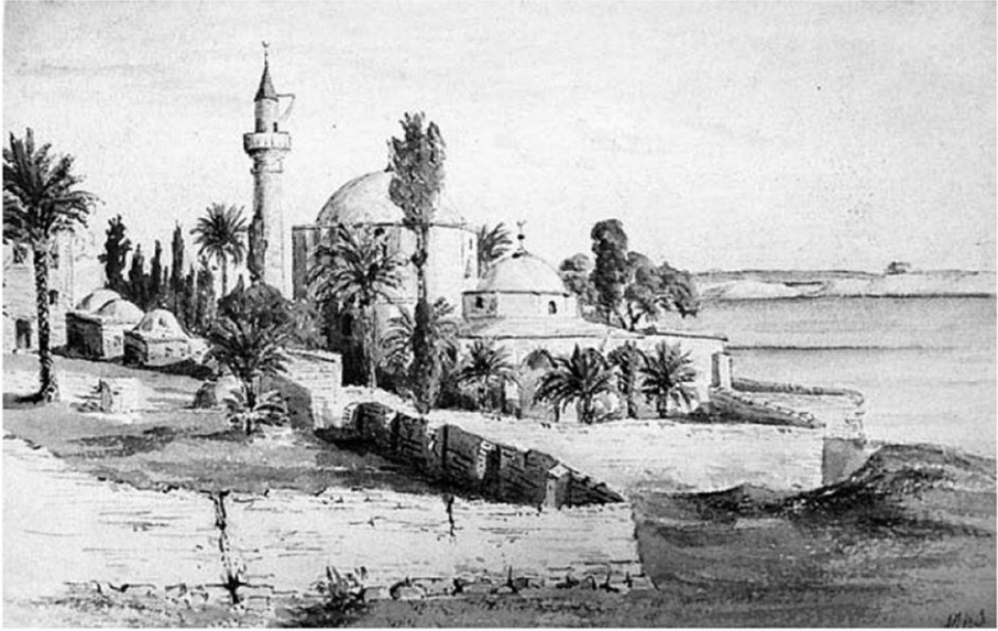
Hugh Sinclair : Mosque of Umm Haram, 1878. (Aquarelle, Collection Costas et Rita Severis)