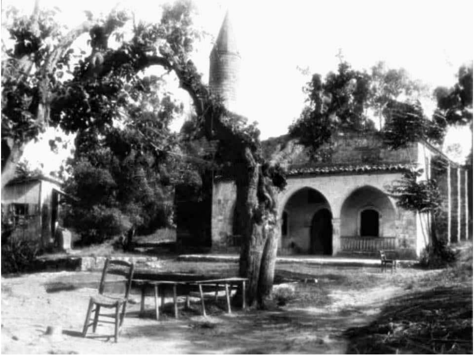
Bayrakdar Camii