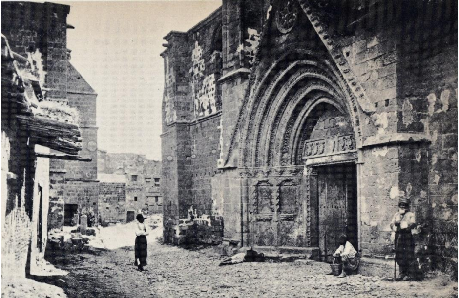
Sağda Lefkoşa Bedesten ve Solda Selimiye Camii (John Thompson 1878.)